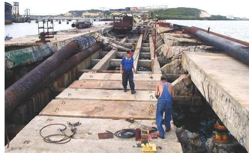
Figura 3. Prueba de Carga en el Puerto de Pastelillo. Nuevitas. Camaguey.