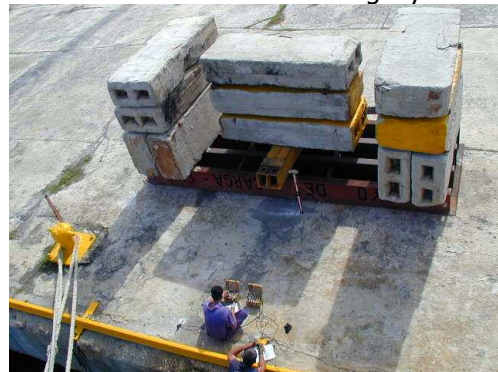
Figura 4. Pruebas de Carga Puerto del Mariel. Base de almacenamiento.

En el siguiente gráfico se representa la metodología utilizada de forma general en la solución de cada proyecto: