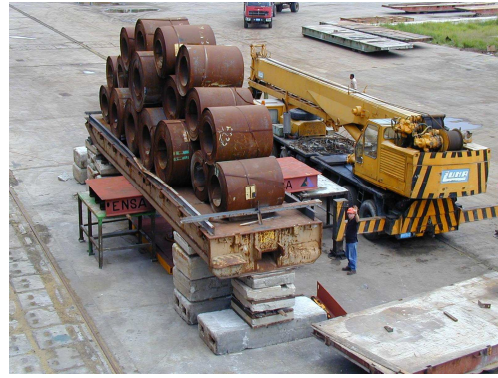
Figura 2. Prueba de Carga Puerto del Mariel. 250 Toneladas.