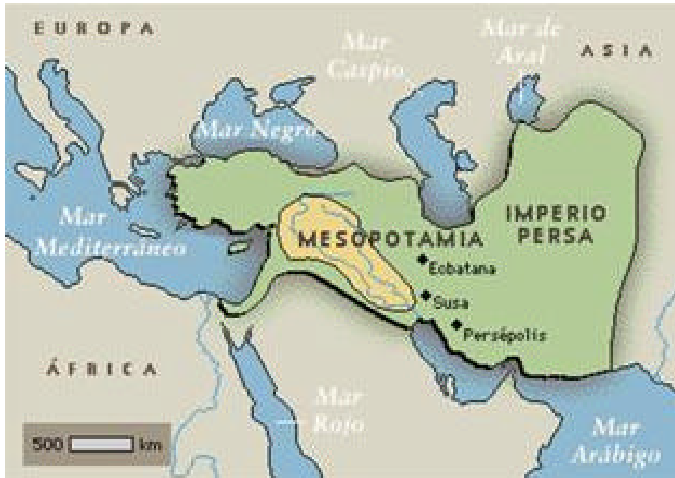
Fig. 1.1 El Imperio Persa

La tabla genealógica de las naciones no menciona a los persas (Gn. 10), cuyo poderío político no se manifestó hasta muchos siglos después de Moisés. Hacia el 700 a.C., Persia estaba entre los países aliados al Elam. Teispés, caudillo tribal, de la dinastía de los aqueménidas, conquistó Elam, proclamándose rey del territorio de Anzán (en el Elam). Tuvo dos líneas de descendientes: una de ellas reinó sobre Anzán, y la otra se quedó en Persia. El sucesor de Ciaxares fue Astiages (585-550 a. C.), monarca que no siguió la línea de su predecesor. Únicamente se conformó con firmar varios acuerdos con los diferentes príncipes de otras tribus persas que se encontraban alrededor de su territorio. Uno de ellos era el gobernador de Anshan, Cambises I, un persa de la familia de los Aqueménidas que, tras el gran Aquemenes, había pasado a estar sometida por los medos. Cambises contrajo matrimonio con la hija de Astiages, la princesa Mandine. El hijo de ambos, en el que confluían los linajes Medo y Aqueménida (de ahí que, debido a los historiadores griegos, medo y persa sean sinónimos) fue Ciro II, el gran conquistador.