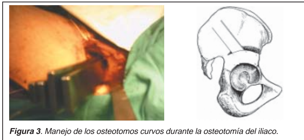
Figura 3. Manejo de los osteotomos curvos durante la osteotomía del iliaco.