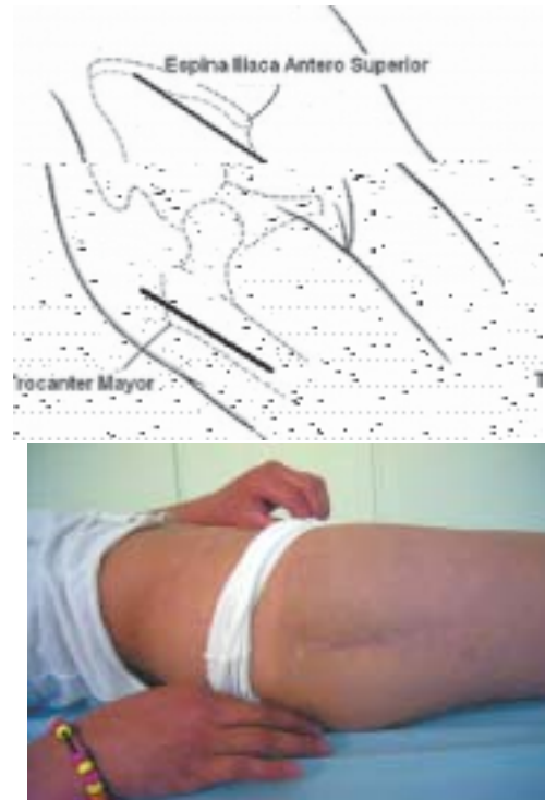
Figura 1. Esquema demostrativo de los abordajes quirúrgicos para el procedimiento tipo DEGA.