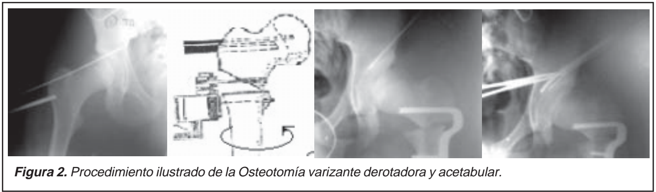
Figura 2. Procedimiento ilustrado de la Osteotomía varizante derotadora y acetabular.